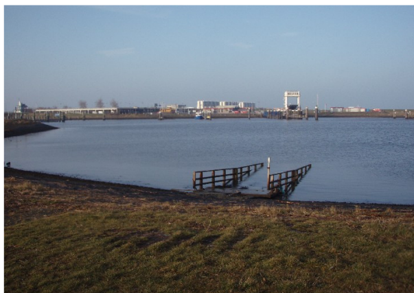
piereneind tegenover de veerhaven Lauwersoog

Lauwersoog: Dit is een veel gekozen vertrekpunt voor kanotochten. Er zijn verschillende vertrekmogelijkheden. Bij laag water kun je het beste vertrekken vanaf een steiger in de vissershaven, ondanks de hoge in/uitstap. Tot ca 2 uur voor en na laagwater kun je terecht op de botenhelling tegenover de veerboten aan de kop van de pier, bij het strandje in de hoek van de pier tegenover het restaurant Pierenend en bij het strandje ten oosten van de vissershaven. Bij laagwater kan ook op de kop van de pier uit/ingestapt worden, als je tussen de los liggende stenen, bezet met scherpe Japanse oesters door weet te laveren.