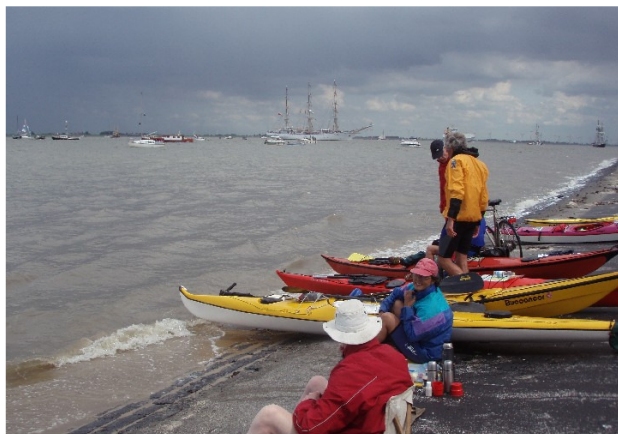
strekdam naar de haven van Delfzijl

De auto's kunnen in de nabijheid geparkeerd worden, maar als het hek naar het gemaal Spijksterpompen dicht is, moeten de boten een stukje gedragen worden tot over de dijk. Als het hek open is, kunnen de auto's tot op de dijk rijden. De tocht naar Borkum wordt er 8 km langer van dan bij vertrek vanaf de Eemshaven.