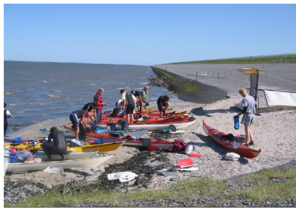
strandje ten oosten van de vissershaven Lauwersoog