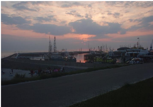
zuidoostelijke arm van de haven van Harlingen

Den Helder: Marinehaven bij de officiersmess, melden bij Traffic Centre Den Helder (tel.0223-542300, marifoonkanaal 62). Paspoort mee. Het schijnt dat je je een maand van tevoren moet aanmelden met opgave van de namen van de deelnemers. Dat maakt in de praktijk de haven praktisch onbruikbaar voor kanoërs.