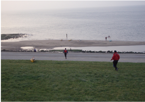
strandje bij Huisduinen

Alle mij bekende vertrekpunten vanaf de vaste wal worden één voor één behandeld van west naar oost, waarbij belangrijke punten als toegankelijkheid, parkeermogelijkheden, bereikbaarheid bij laagwater, e.d. de revue passeren.