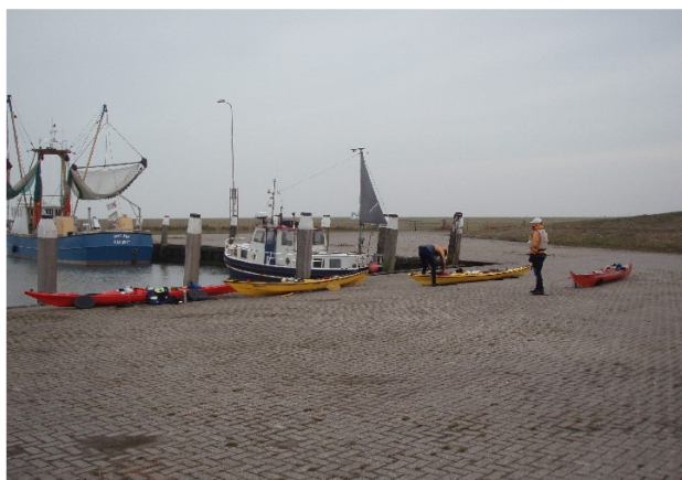
haven van Noordpolderzijl

Noordpolderzijl: Bij laagwater is de haven zelfs voor kano's onbereikbaar en kun je alleen via een van de ijzeren trapjes tegen de kade in en uit het water. Het slik is te zacht om door heen te kunnen lopen. De slagboom is meestal dicht en alleen met een pasje te openen. Door de week is de slagboom zonder pasje te openen als het tenminste niet te druk is. Wanneer er dan een auto voor de slagboom gaat staan, gaat de slagboom zonder pasje omhoog. Voor het openen van de slagboom voor de haven van Noordpolderzijl bellen met: de heer Schoonveld, tel 06-20615951 Waterschap Noorderzijlvest. Wanneer je 's morgens vroeg door de slagboom wilt, bel dan de avond te voren dan zet hij het systeem 's avonds al op "open". Bovenstaande regeling is afgesproken met de heer Schoonveld op 23