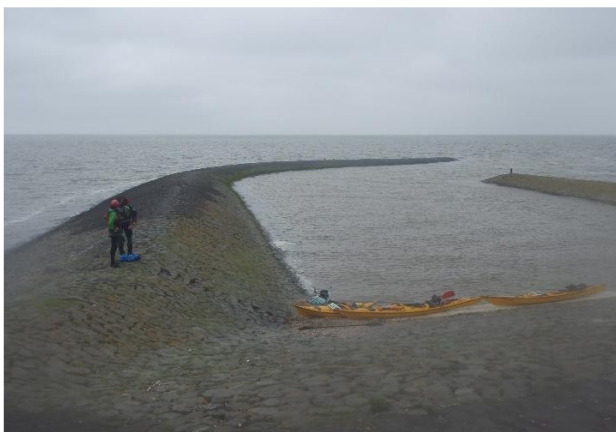
het “haventje” van Roptazijl

Harlingen: De grootste haven van het Wad met veel scheepvaartverkeer, mede omdat het Van Harinxmakanaal daar uitkomt. Kano's kunnen het beste aan het uiteinde van de zuidelijke arm van de haven te water gaan. Daar kun je ook je auto in de buurt laten staan. Een alternatief is op een plek met lage oevers in de grachten van Harlingen in te stappen. Nadeel is dan dat je geschut moet worden voor je de buitenhaven in kunt varen. Niet alle sluizen in de stad worden bediend.