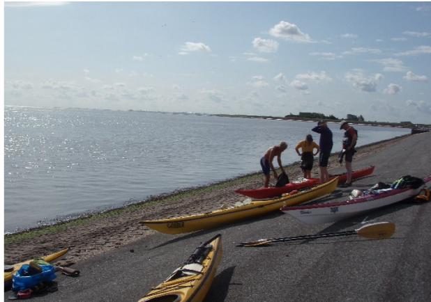
de dijk bij Spijksterpompen (Vierhuizen)

alternatieven een strandje iets meer naar het westen waar de dijk naar het zuiden afbuigt (alleen met hoog water), de hoek van dezelfde dijk als deze weer naar het westen afbuigt (1 km lopen over verharding onder aan de dijk om dat punt te bereiken) en Vierhuizen (zie hieronder).