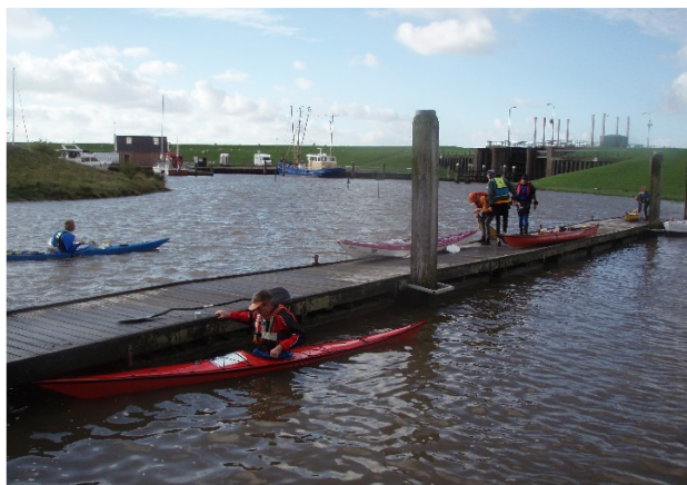
drijvende steigers in de haven van Termunterzijl

Delfzijl: Het strand bij Delfzijl is bij laagwater ongeschikt als vertrek/ aankomstpunt vanwege het droogvallend slik voor het strand. Wel is het mogelijk te vertrekken of aan te landen bij de strandjes aan de strekdam langs het zeehavenkanaal naar de haven van Delfzijl.